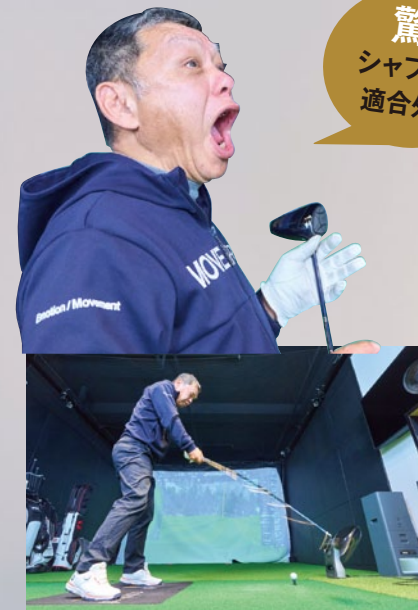
異方性の強い超カットス イングのガッデム竹田でも、 気持ちよくミートしていた。

シャフトの正面側と横側で意図的に異 方性のしなり方をコントロールしたルー ル適合外シャフト。切り返してタメが作 りやすく、インパクトでトゥダウンを抑え てくれ、安定飛距離に貢献する。